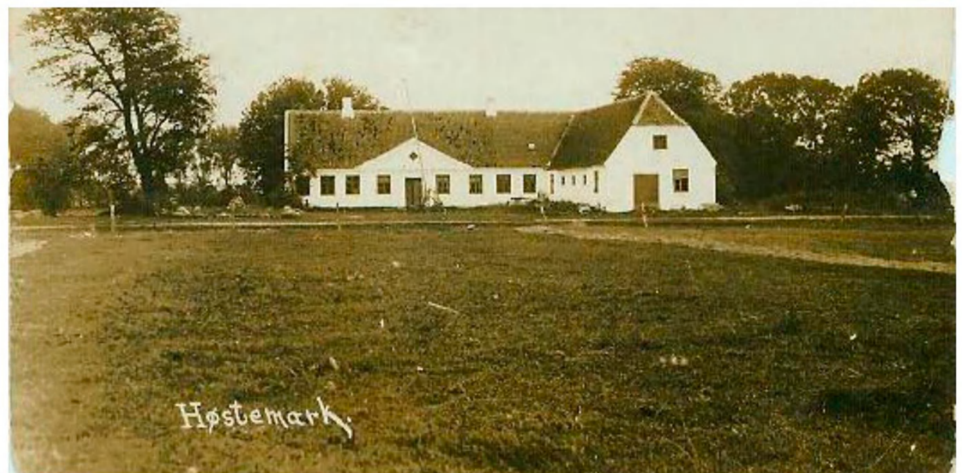
Høstemark Gård i slutningen af 1800-tallet.