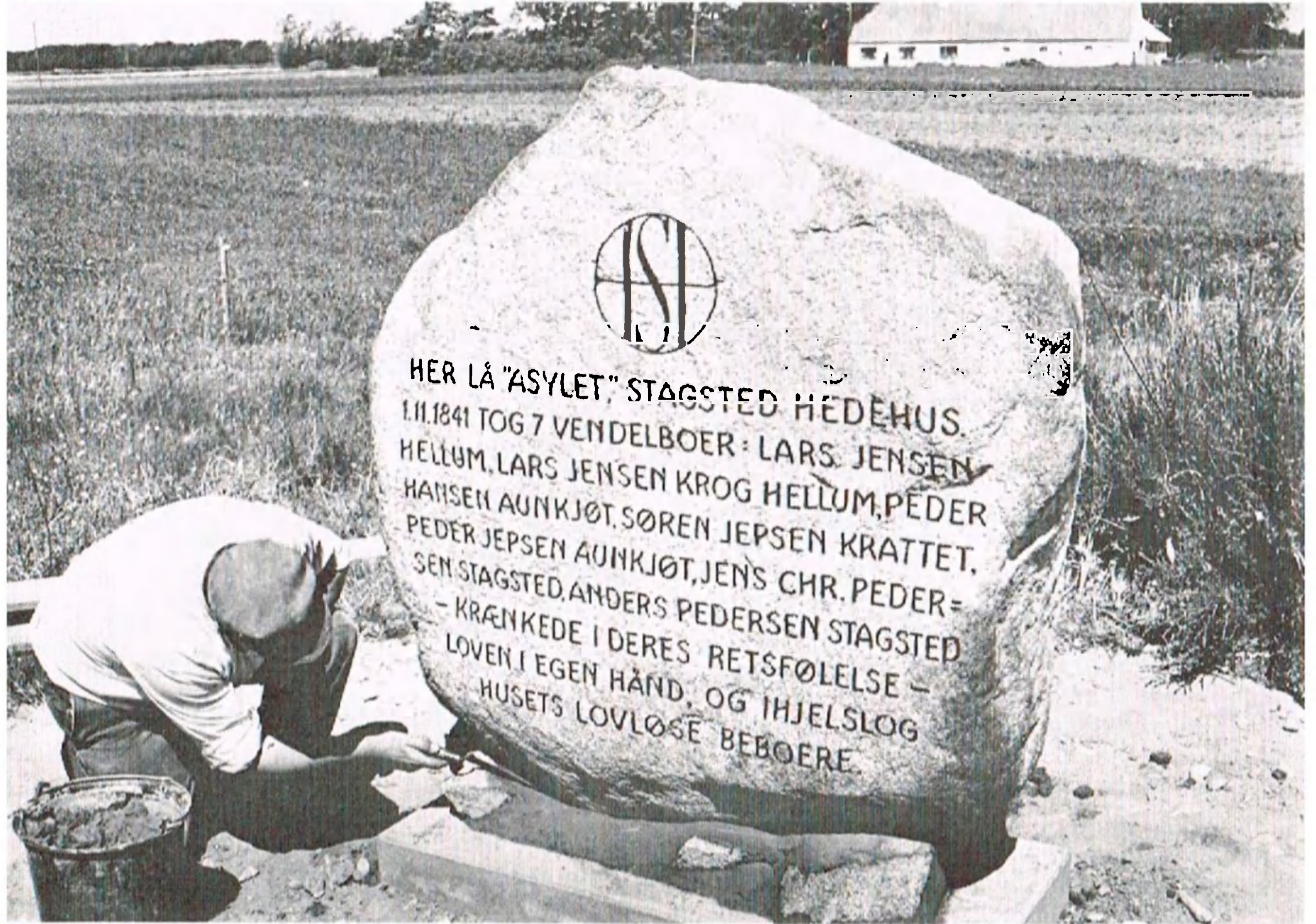
Mindesten for myrderiet i Stagsted Hedehus.