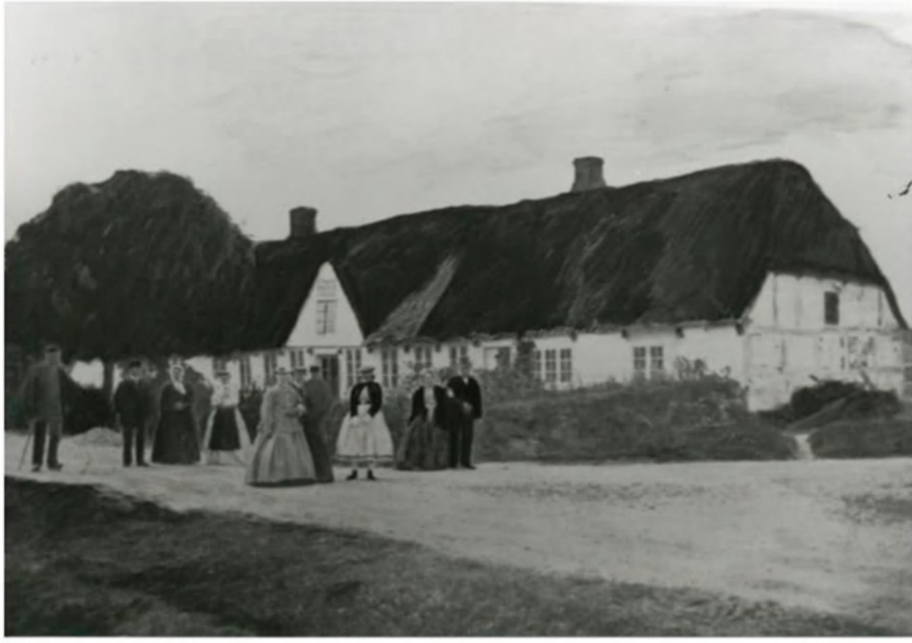
Ans Kro eller Hvide Kro i 1868, nedrevet 1875, billede fra lokalarkiv Blichereggen.