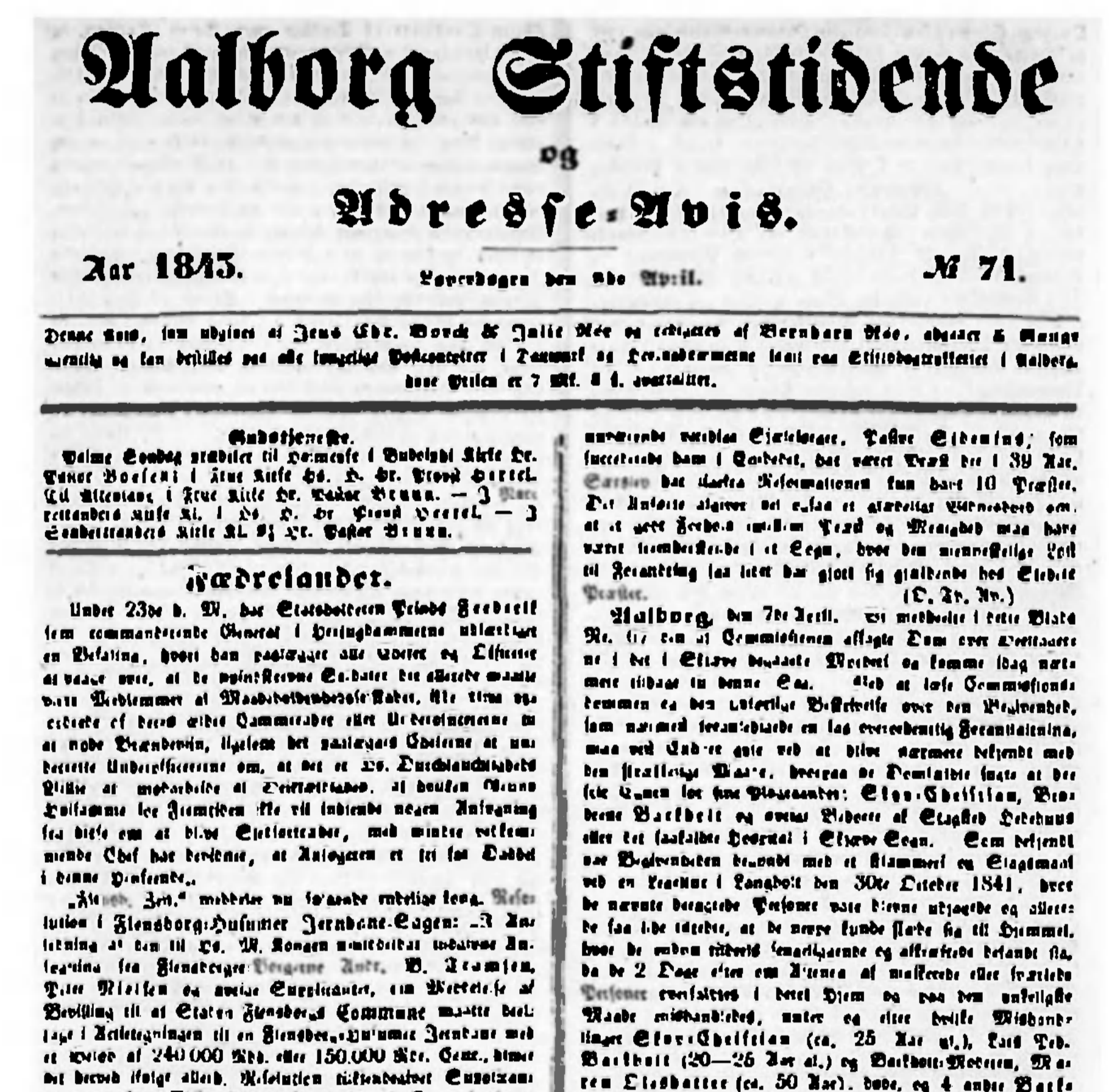
Aalborg Stiftstidende 8.4.1843 om Skævebanden.

De sårede forsøgte at sove trods deres ret alvorlige skrammer, men mandag morgen kl. 9-10 trængte en lille flok mennesker ind til dem. De mishandlede og torturerede de 3 og brødrenes mor